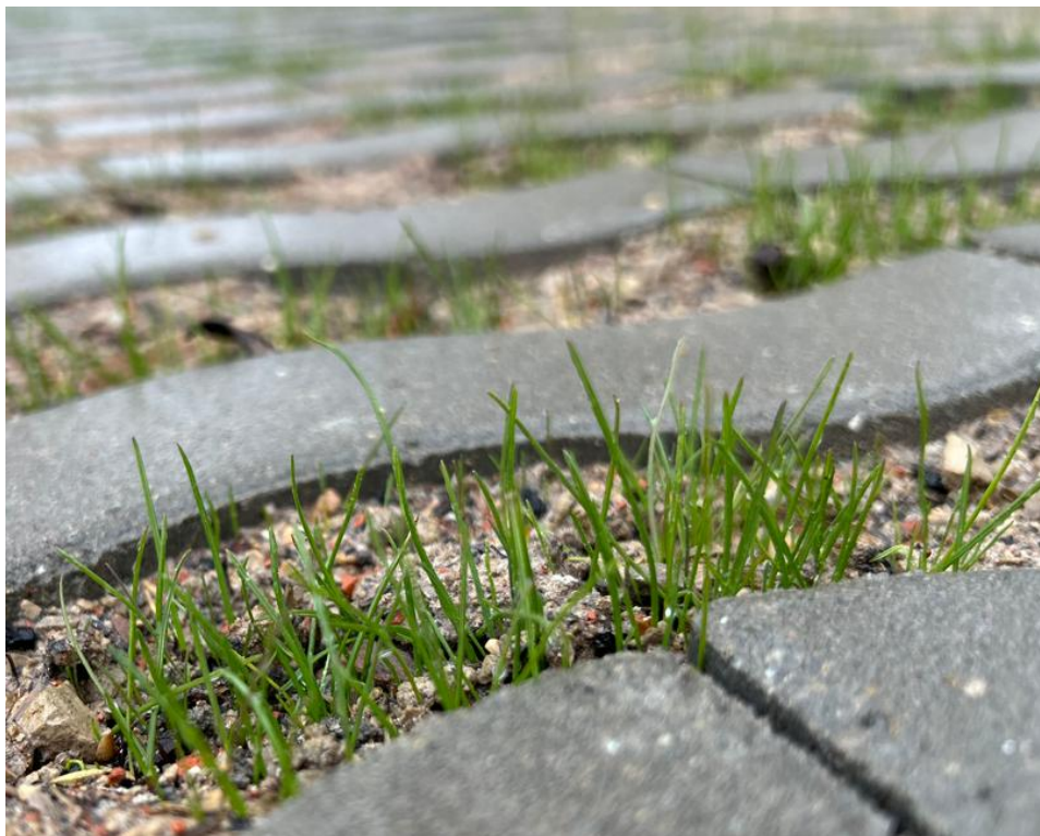
Kammer Füllung mit Koveg M1 Rasensubstrat 12 cm stark