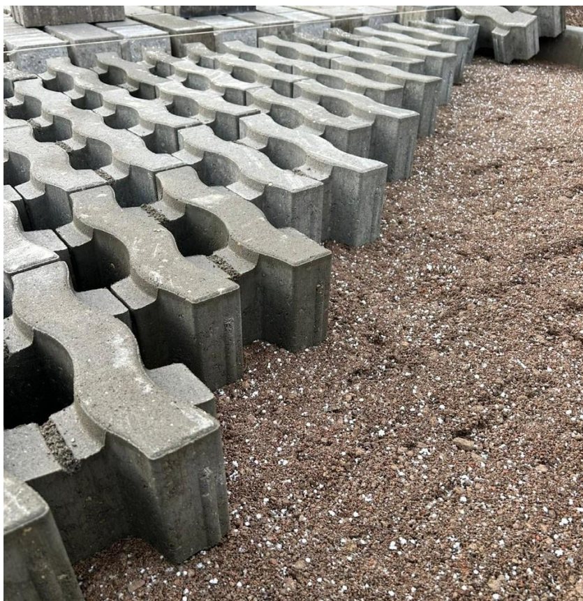
Bettungsschicht aus Koveg M1 0-16 mm, ca 5 cm stark